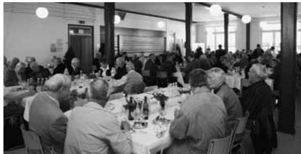
Les participants partagent le repas

La création décidée de la Fondation, qui sera dotée d'un capital de 50 000 francs, est sans importance pour le budget puisque le montant sera prélevé des fonds propres.