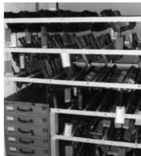
Des armes à feu d'un entrepôt extérieur à libérer

Pour que vous puissiez vous faire une petite idée des travaux, je mentionnerai trois parties de la collection qui demandent un énorme travail: