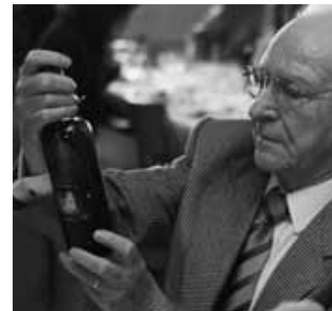
Les participants partagent le repas

Les dispositions régissant la collaboration entre la Vsam et la Fondation précisent notamment