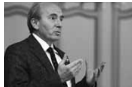
Jürg Stüssi transmet les meilleurs messages du conseiller fédéral Samuel Schmid