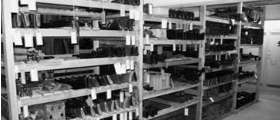
Des armes automatiques d'un entrepôt extérieur à libérer

vaux) de Sarnen, Bulle, Corbières et Wengi près de Frutigen, techniquement très délicat, est en cours. Comme certains des fourgons du génie mesurent plus de 10 mètres et sont parfois très fragiles, le transport demande énormément d'attention et d'importantes mesures de précaution. Nous saisissons l'occasion de ces transferts pour établir un dossier de chaque objet, avec l'état de détail, les données techniques et des photos.